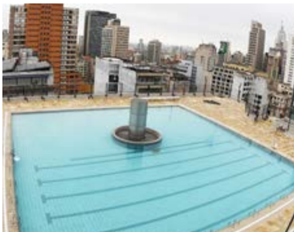
Piscina no terraço do prédio de 13 andares com vista panorâmica