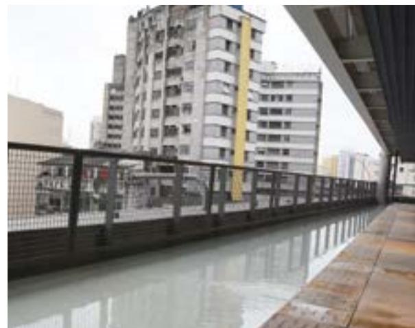
Usuários poderão andar no espelho d'água, localizado no 11º piso