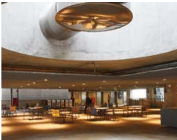
Jardim da piscina, no 11º andar, contempla uma cafeteria