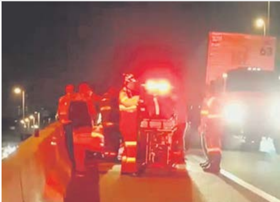
Polícia identificou motorista suspeito de atropelamento, mas ele seguia foragido ontem