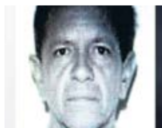
Motorista suspeito está foragido

Ativistas marcam bicicletada Organizada em toda última sexta-feira do mês, a bicicletada de setembro foi antecipada pelos cicloativistas. Contra a morte do pintor Gilmar Barbosa da Mata, os ciclistas se reunirão hoje, às 20h, na Praça dos Ciclistas, Avenida Paulista. O evento no Facebook tinha 500 confirmações ontem à noite. Os ativistas levantam a bandeira que "Não foi acidente".